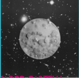
MARCO CASTELLI >A Micro Odyssey

LA CONTAMINAZIONE VIOLA LE REGOLE PRESTABILITE CON LA SUA FORZA RIVOLUZIONARIA CARICA DI PROMESSE, PRESAGI, AMBIGUITA'