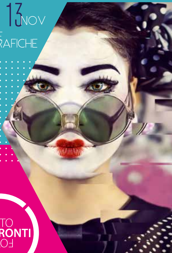
FOTO CONFRONTI FOTO