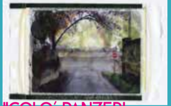
NICOLO' PANZERI >Sătŭra