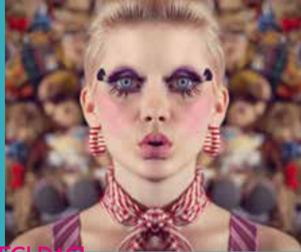
EGI DACI >Ritratti Simmetrici